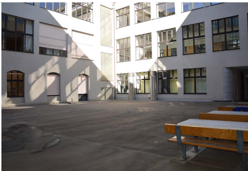
CAB Innenhof Süd

ETH Zürich Abteilung Campus Services Bewilligungen Binzmühlestrasse 130 8092 Zürich