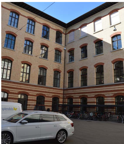
CAB Innenhof Nord