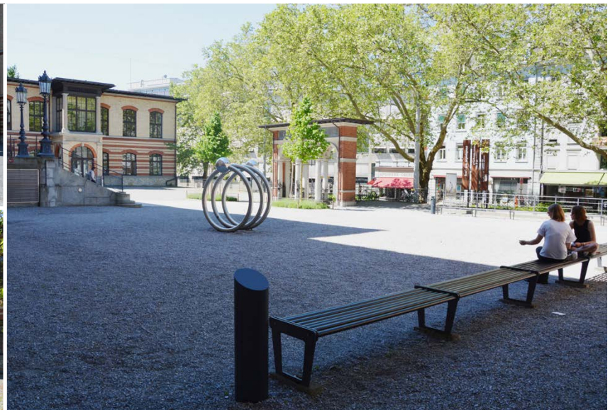
Oben: CAB Kiesplatz links Rampe